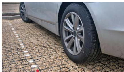
MARKIERUNGSELEMENTE Schnelles Kennzeichnen von Parkplätzen